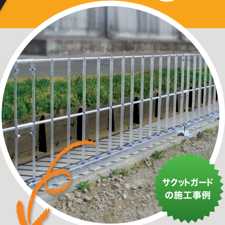
サクットガードの施工事例