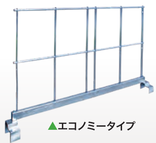
▲エコノミータイプ